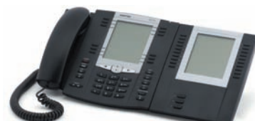
Aastra 6757i en de M675i module